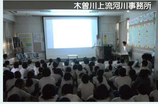
木曾川上流河川事務所 牧田川の治水の歴史について講義