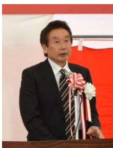
細江岐阜市長 ＜挨拶＞