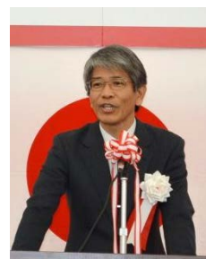
浅野木曾川上流 河川事務所長 ＜事業報告＞