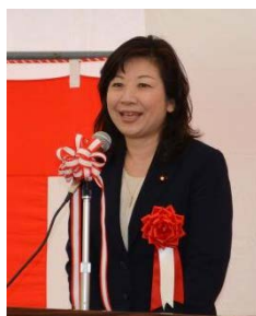
野田衆議院議員 ＜祝辞＞