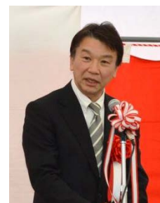
大野参議院議員 ＜祝辞＞