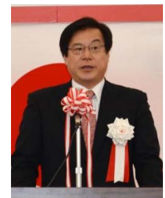
八鍬中部地方整備局長 ＜式辞＞