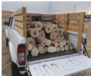
※無料配布する樹木のイメージ

その他：荒天（注意報発令）の場合、中止となりますので、当日の中止確認は「問合せ先」までお願いします。（留守番電話に切り替わりますので、後ほど担当の者から折り返し電話します）