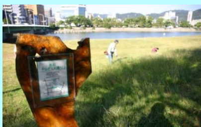
市民団体による看板設置事例（太田川）