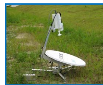
可搬型衛星通信装置 (Ku-SAT)