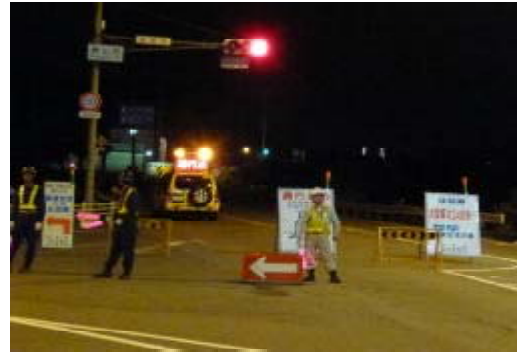
通行止め実施状況 (写真は勝山西交差点付近)