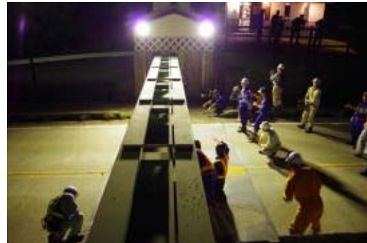
陸閘点検実施状況