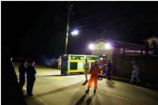
陸閘閉鎖作業状況