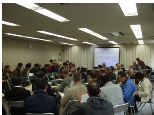
第7回ふれあいセミナー開催状況