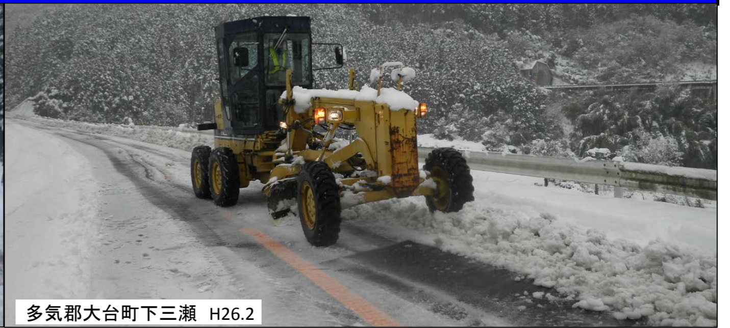
多気郡大台町下三瀬 H26.2