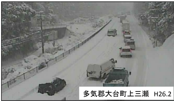
多気郡大台町上三瀬 H26.2