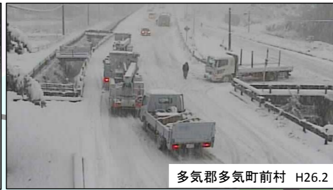
多気郡多気町前村 H26.2