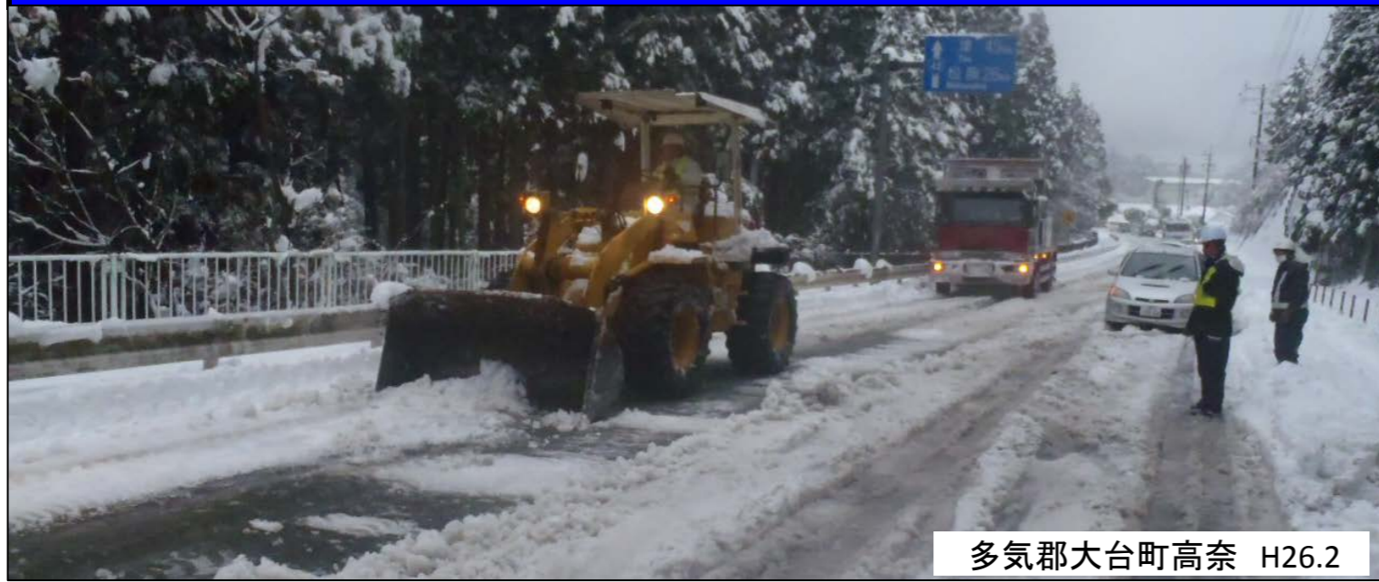
多気郡大台町高奈 H26.2