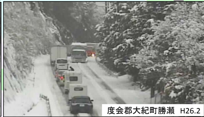
度会郡大紀町勝瀬 H26.2