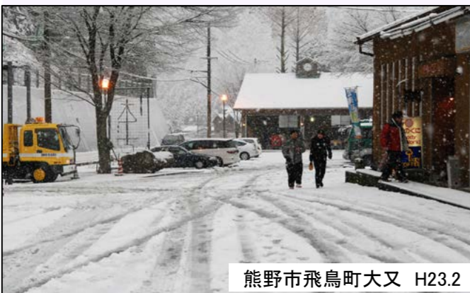
熊野市飛鳥町大又 H23.2