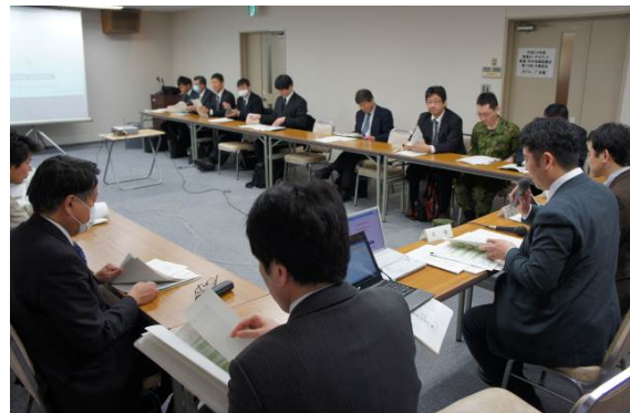
各グループ（左：Aグループ、右：Bグループ）の討論型図上訓練の様子