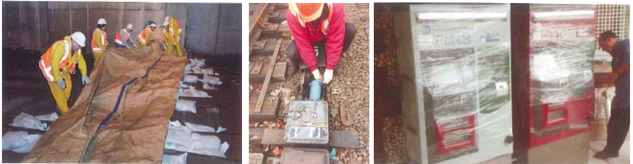
ハリケーン・サンディでの地下鉄会社の浸水防止の取組

（例2）平成24年10月のアメリカ合衆国におけるハリケーン・サンディの災害では、地下鉄会社において、ハリケーンによる被害が生じるまでのリードタイムを利用して、水のうによる止水対策や、線路のポイント部分のモーターの取り出し、券売機の止水対策などが行われました。