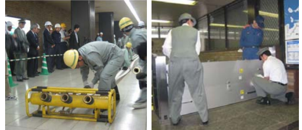
訓練の様子（博多駅浸水防止合同訓練）

（例1）博多駅では、鉄道事業者、駅周辺のビル、ホテル等の事業者が合同で、危険水位の通報連絡、止水板設置、可搬式ポンプ設置等の浸水防止訓練を実施しています。