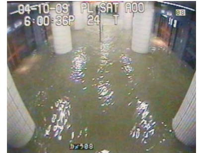
地下3階の地下鉄駅ホームの浸水状況 (平成16年10月台風22号(麻布十番駅)) (出典：中央防災会議 大規模水害対策に関する専門調査会報告)