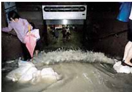
地下街の浸水状況 (平成11年6月福岡水害(博多駅))