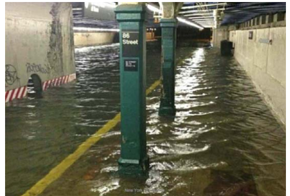
ニューヨーク市内の地下鉄駅の浸水状況 (平成24年10月)

平成11年の福岡水害では地下室の浸水で1名が死亡し、平成12年の東海豪雨では、名古屋市営地下鉄が最大2日間の運転停止、約47万人の足に影響を与えました。