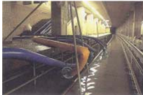
地下鉄線路の浸水状況 (平成12年9月東海豪雨(平安駅))