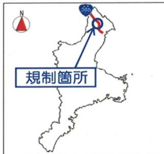
通行止めのイメージ