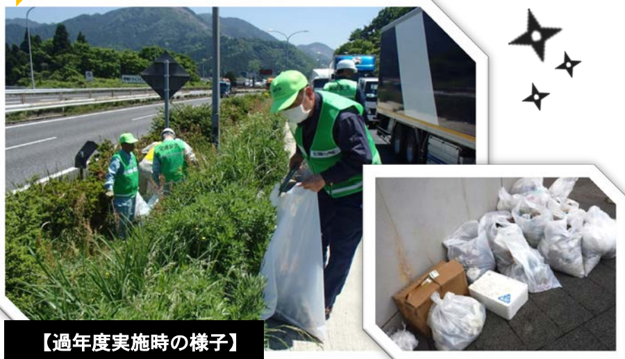
【過年度実施時の様子】