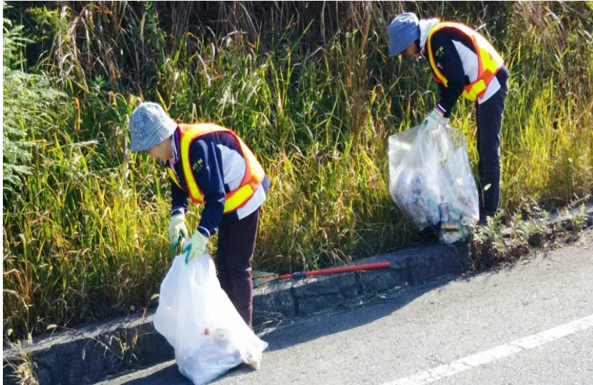
写真撮影箇所：名阪国道上り(名古屋方面)伊賀一之宮IC付近