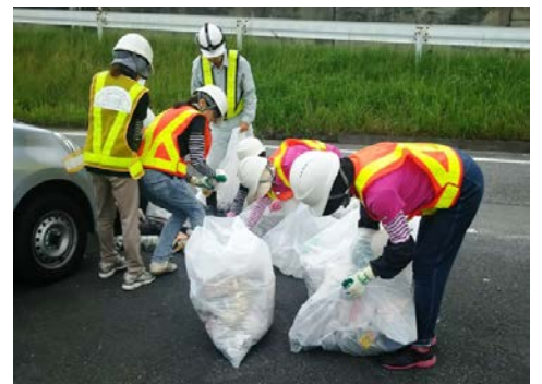
【過年度の活動の様子】

名阪国道では、不法投棄や落下物、ポイ捨てなどが頻発しています。道路利用者の皆様が道路を快適に利用して頂くためにも、ゴミの投げ捨てはお止め頂きますようお願いいたします。