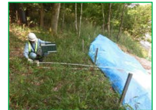
法面点検イメージ

3. 取材について 取材を希望される方は、下記問い合わせ先へ連絡をお願いします。