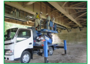
橋梁点検イメージ