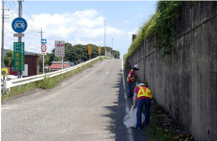
写真撮影箇所：上り(名古屋方面)伊賀一之宮IC降り口付近