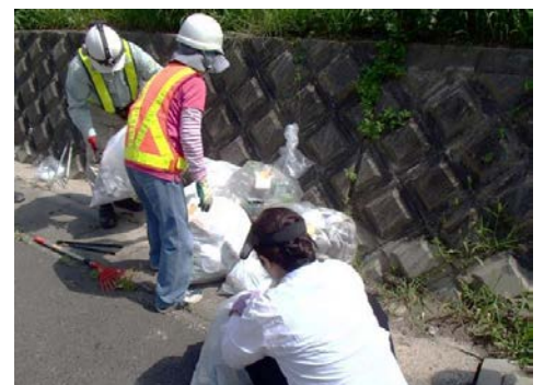
【過年度の活動の様子】

名阪国道では、不法投棄や落下物、ポイ捨てなどが頻発しています。道路利用者の皆様が道路を快適に利用して頂くためにも、ゴミの投げ捨てはお止め頂きますようお願いいたします。