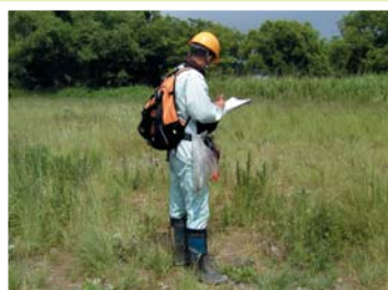
植物調査のようす

河川水辺の国勢調査（植物調査）では、代表的な調査地区を設定してその範囲内を歩き、生育している植物の名前を記録する植物相調査や、植物がどの範囲にひろがっているかを地図上に記録する植生分布調査などが行われています。