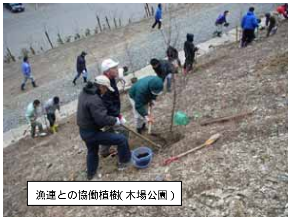
漁連との協働植樹(木場公園)