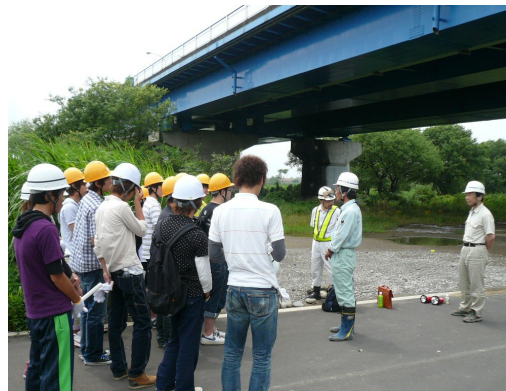
一般国道21号 穂積大橋 技術系学生による橋梁見学(左)と、箱桁内部の見学風景(右)