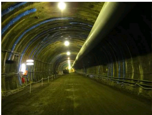
一般国道156号 岐阜東バイパス 岩田山トンネル工事