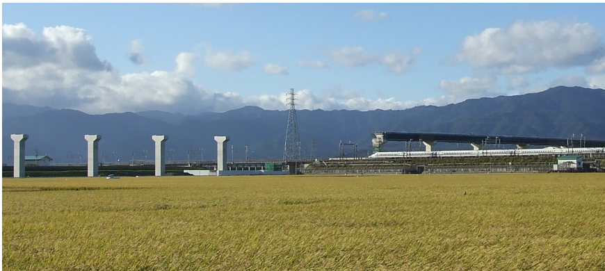
工が進む東海環状自動車道 西部区間;大垣地区(平成22年10月撮影) (東海道新幹線北側(写真右)は高架橋の架設中、南側(写真左)は橋脚が完成)

こうした地域づくり・道づくりを、来るべき次世代に引き継いでいくことを目的として、積極的に地域住民の方々や自治体はもとより、 次世代を担う学生の方々に現場見学のフィールドを提供していきますので、ご活用ください。