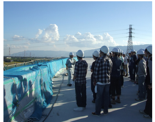
東海環状自動車道 大垣地区 工事中の高架橋上からの見学風景