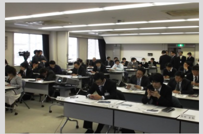
マスコミ取材もありました