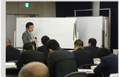
国総研室長の熱のこもった講義