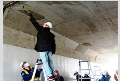
打音検査の様子(函渠)