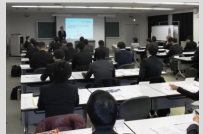
熱心に受講する参加者