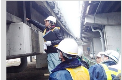
桁端部の損傷状況の確認