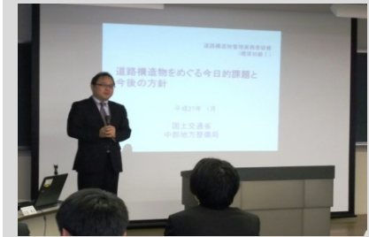
道路部長の講義で5期に亘る研修がスタート!