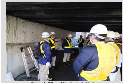
現地実習で説明する講師