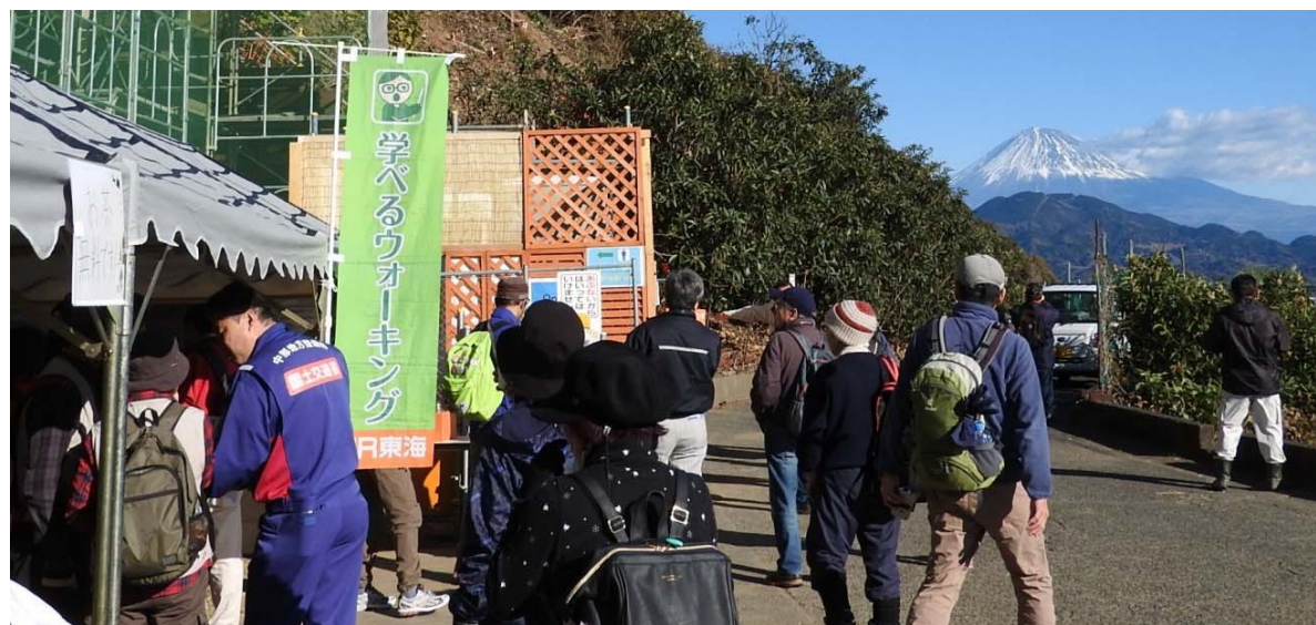
晴天の中、さわやかウォーキングが開催