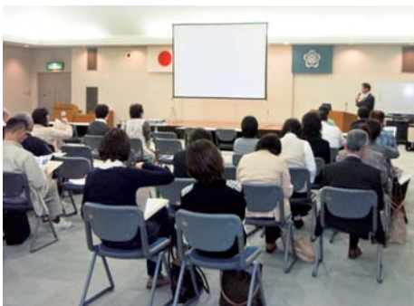
11月10日 富士宮市介護保険事業者

平成21年4月～平成22年1月までに、約1800名の皆様が富士砂防事務所が所管する大沢崩状地・大沢崩れや由比地すべり対策箇所を訪れ、砂防事業等について理解を深めていただくことができました。