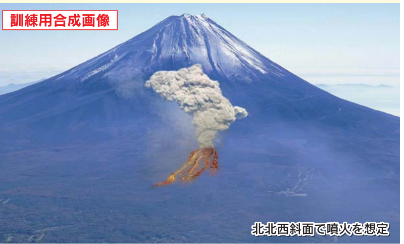
北北西斜面で噴火を想定