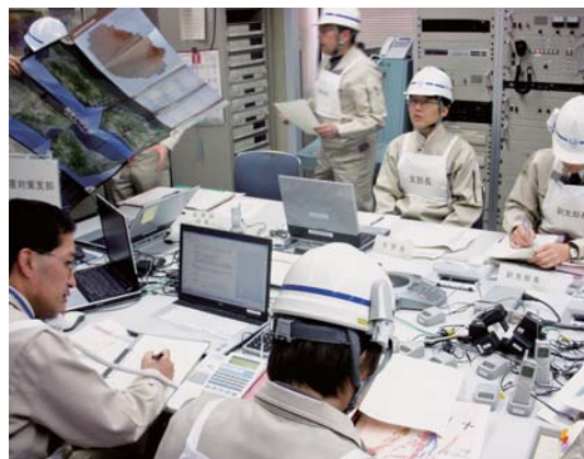
プレイヤーの状況【訓練中】