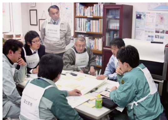
イメージトレーニングでの検討状況

今後、訓練結果およびアンケート結果を取りまとめ、参加市町村へフィードバックすることで、噴火災害における対応マニュアル作成などの基礎資料としての活用を期待する。