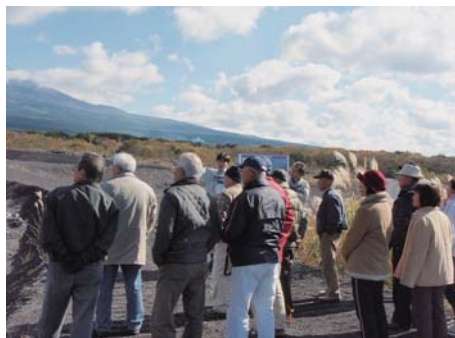
11月20日 岩本山の環境と水を守る会