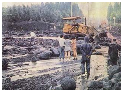
富士宮市上井出の河底橋