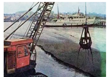
田子の浦港土砂堆積

昭和45年、国は富士砂防工事事務所(現富士砂防事務所)を設置するとともに、大沢川砂防基本計画を策定し、現地では大沢第8・第9床固工事に着手するなど、工事も本格化してきました。しかしながら昭和47年、大沢川では4たびにわたる土石流や豪雨が発生し、下流域に多大な災害をもたらしました。