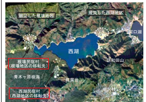
西湖周辺の垂直航空写真

移転先では恵まれた自然環境を生かした民宿村として新たにスタートし、復興に向けて歩み始めました。