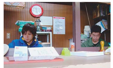
富士山頂郵便局で業務にあたる職員

※明治42年～昭和17年は大宮郵便局（現在の富士宮郵便局）が受け持ち局、昭和24年～昭和27年は御殿場郵便局が受け持ち局、昭和28年～現在は富士宮郵便局が受け持ち局となっています。