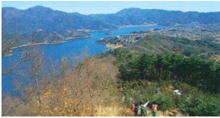
足和田山から見た河口湖と御坂山塊

東京の「明治の森高尾国定公園」から、大阪府「明治の森箕面国定公園」までを結ぶ、全長約1,343kmのコースで、中でも富士山麓をめぐるコースは富士山の麗姿と富士五湖を堪能できる人気のコー