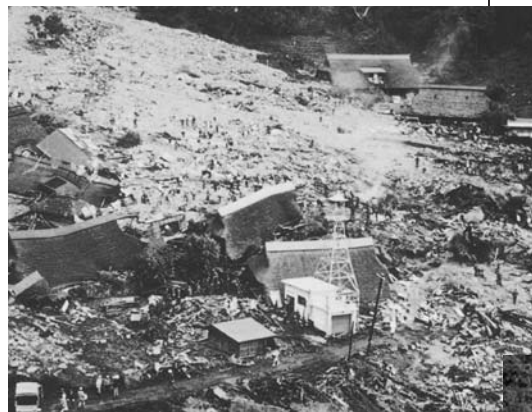
土石流で崩壊した根場地区

本沢川、三沢川で発生した土石流は、それぞれ根場地区、西湖地区の中心部を直撃し、その結果、根場地区では人口235名のうち死者・行方不明者63名、西湖地区では人口513名のうち死者31名をという大きな災害が発生しました。