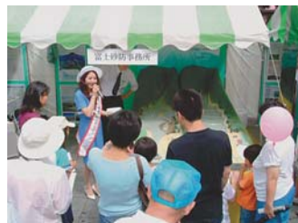
砂防フェスティバル