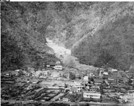
土石流で崩壊した西湖地区

災害から1年後の昭和42年9月25日、根場・西湖地区それぞれで慰霊祭がとりおこなわれ、これを区切りとして、復興へ本格的に取り組み始めました。根場・西湖地区はもともと養蚕・林業・酪農で生計を立てていましたが、住宅・耕地・牛・全ての生活基盤を奪われてしまい、新しく生活基盤をみつけないければならない状況に置かれ、ほとんどの人は裸一貫の再出発となりました。