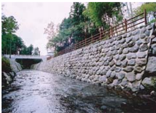
平成15年度 富士山大久保沢溪流保全工及び橋梁付替工事

富士砂防事務所が発注し、平成16年度中に完成した工事において、特に優秀な成績をおさめた施工者等に中部地方整備局長表彰、富士砂防事務所長表彰を行いました。また、優れた施工技術をもつ下請業者に感謝状を贈呈しました。