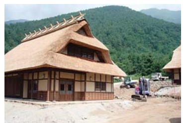
「西湖いやしの里 根場」整備状況

現在では、災害のあった根場地区において、富士河口湖町の取り組みにより、「西湖いやしの里 根場」として災害以前の素朴な茅葺き屋根の集落を再生する事業が進められています。