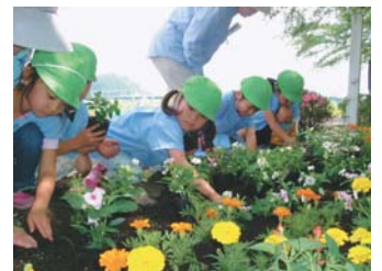
フーちゃん公園花植え