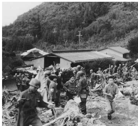
救援搜索活動（根場地区）

地元の住民は誰もがなんらかの形で被害を受けており、救出活動を行える状態ではありませんでした。そのような状況下、自衛隊による搜索活動は10月7日まで、延べ