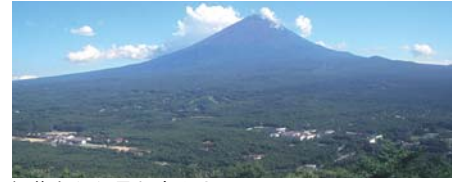
紅葉台から見た富士山