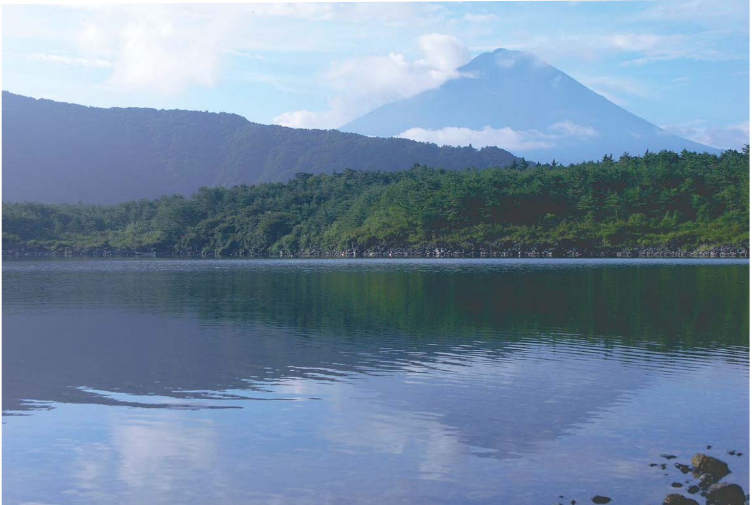
西湖北岸より富士山を望む