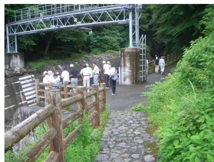
大沢扇状地岩樋観測所