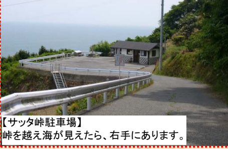
【サッタ峠駐車場】峠を越え海が見えたら、右手にあります。