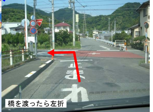
橋を渡ったら左折