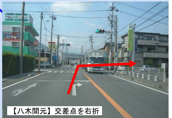
【八木間元】交差点を右折