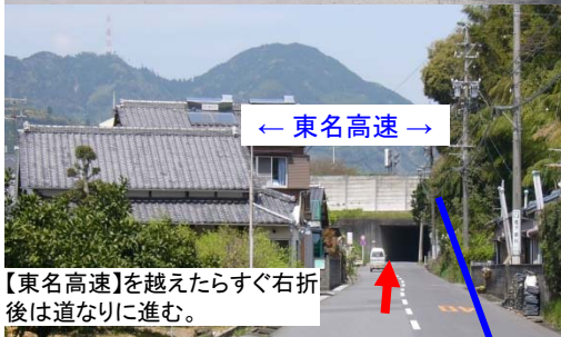
← 東名高速 →