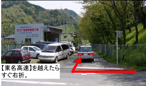
【東名高速】を越えたらすぐ右折。