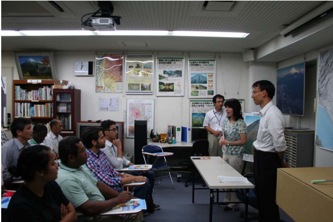
富士砂防事務所において新宅事務所長が歓迎の挨拶