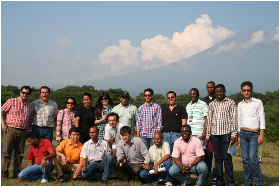
大沢扇状地において富士山をバックに記念撮影