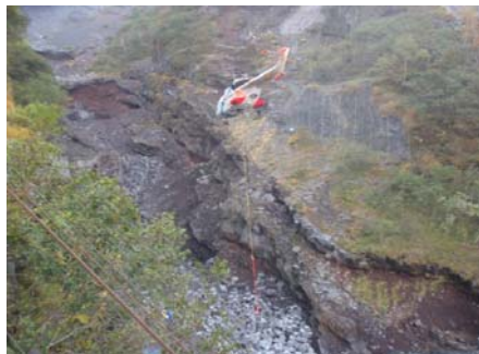
ブロック設置状況 (昨年度の施工状況)