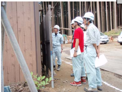
鞍骨流路工事にて工事担当者より説明