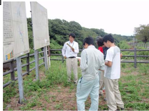
大沢扇状地にて施設の説明