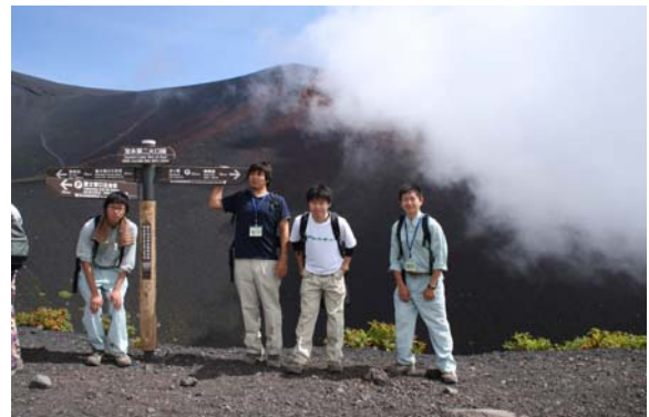
宝永噴火について学ぶ