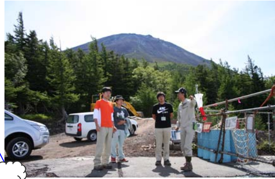
御庭ヘリポートにて対策工事について説明