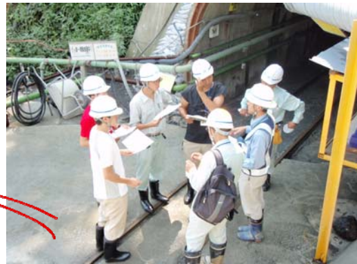
排水トンネル工事説明