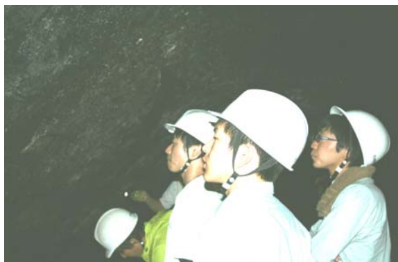
西湖コウモリ穴で貞観噴火の溶岩流について学ぶ