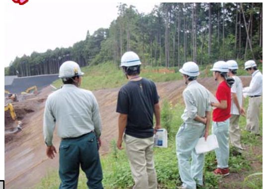
砂沢沈砂地にて工事担当者より説明