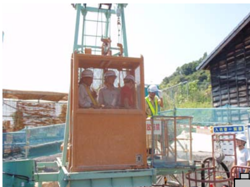
エレベータにて深礎杭の中へ