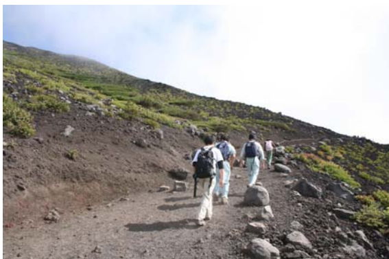
宝永火口へ向って富士山を登る