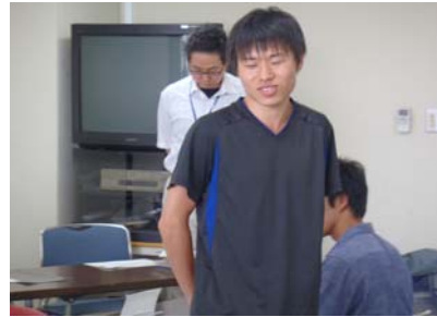
開講式(参加者自己紹介)