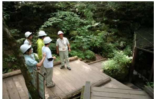
青木ヶ原樹海で原生林の植生を学ぶ