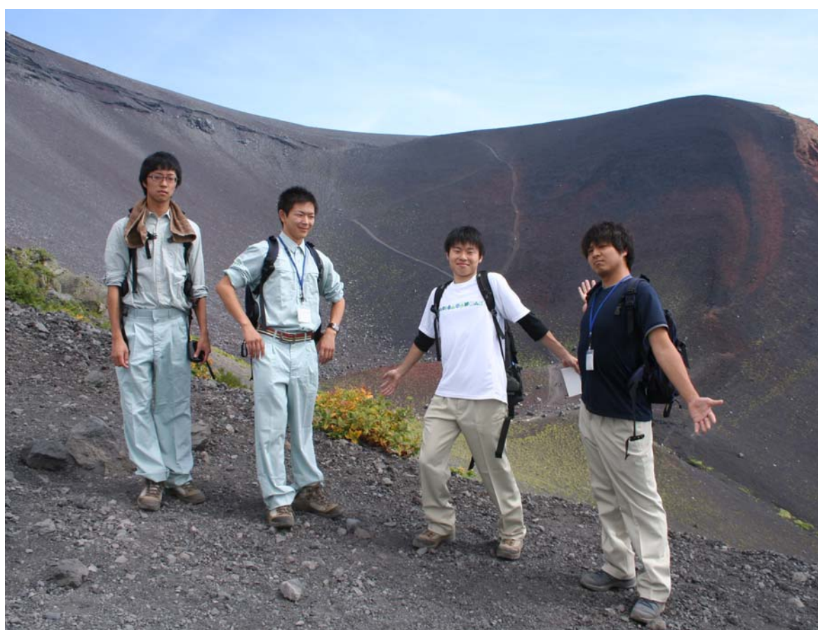
富士山 宝永火口にて