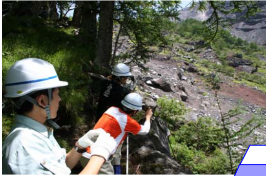
大沢崩れについて学ぶ