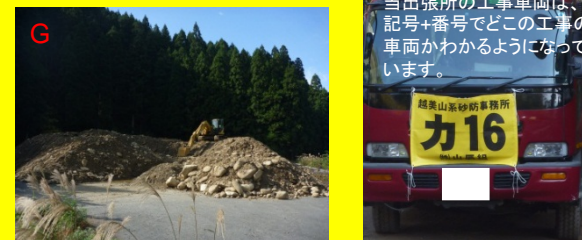
H 当出張所の工事車両は、記号+番号でどの工事の車両かわかるようになっています。

どんな工事においても、土砂などを置くバックヤードが必要である。特に、急峻な地形の中で行う砂防工事現場では、現場外にバックヤードを設けることしばしば。移動にはダンプの運搬が必要不可欠。どうぞ皆様、ご理解をお願いします。