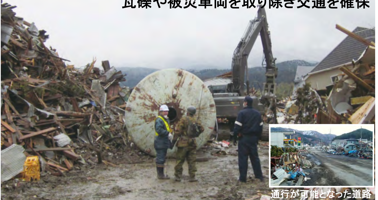
通行が可能となった道路