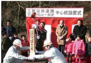
岩手県宮古市 中心杭設置式 2011.12.23

広域的で災害に強い道路ネットワークは、 産業を支え、地域経済を活性化する。 災害時には、避難路として、あるいは救援道路・ 緊急輸送道路として機能する。 「一日でも早く、被災地域が元気を取り戻し、 安心して暮らせるように」、関係機関が一丸となった プロジェクトがスタートした。